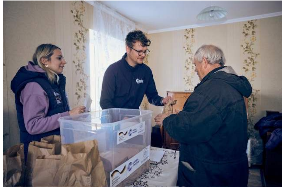
© 2025 action medeor e.V. Max Hoßfeld