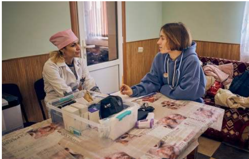
Projekt Mobile Apotheke Oblast Kherson