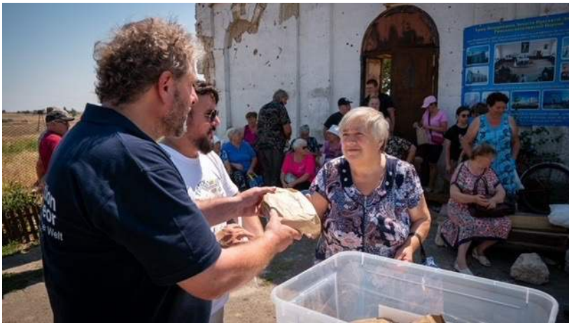
© 2025 action medeor e.V. Dr. Markus Bremers